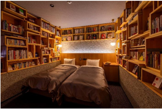
コンセプトツイン「言 -koto-」(テーマ:食)