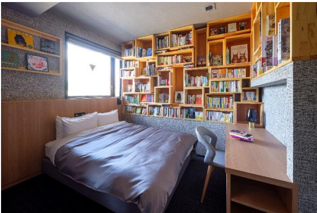
コンセプトダブル「読 -toku-」(動物)