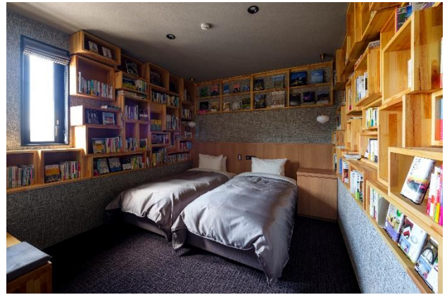
コンセプトツイン「黙 -moku-」(旅)