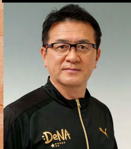
横浜DeNAランニングクラブ 総監督