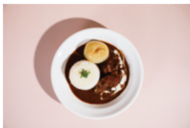
看板メニューの牛ほほ肉のハヤシライス