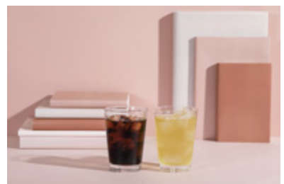
珈琲と煎茶はおかわり自由